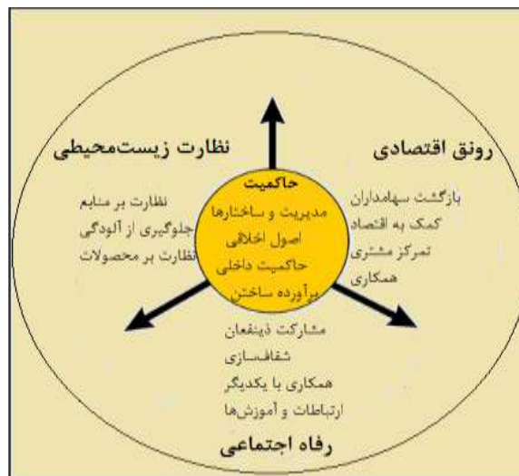
نمودار شماره ۲: چهار جزء اصلی توسعه پایدار: رونق اقتصادی، رفاه اجتماعی، نظارت زیست محیطی و حاکمیت (کوپر، ۲۰۰۸)

در تبیین مفهوم توسعه پایدار گردشگری چهار عامل زیر مهم دانسته شده است: