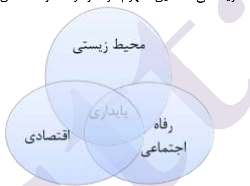
نمودار شماره ۳: مفهوم پایداری (لی و اونویل، ۲۰۰۴)

بنابر لیبی و اونویل ۲ (۲۰۰۴) پایداری فرآیندهای هم افزا که به‌وسیله‌ی آن ملاحظات محیط زیست محیطی، اقتصادی و کیفیت زندگی به طور موثری برنامه‌ریزی پروژه، طراحی، ساخت، اجرا و نگهداری را در برآورده کردن نیازهای حاضر بدون به خطراتادن نیازهای نسل آینده تعریف می‌کند. این مفهوم در نمودار شماره ۳ نشان داده است.